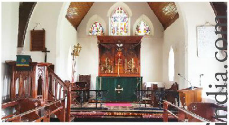
നെഗബോയിലെ സെന്റ് സ്റ്റീഫൻസ് ചർച്ച്