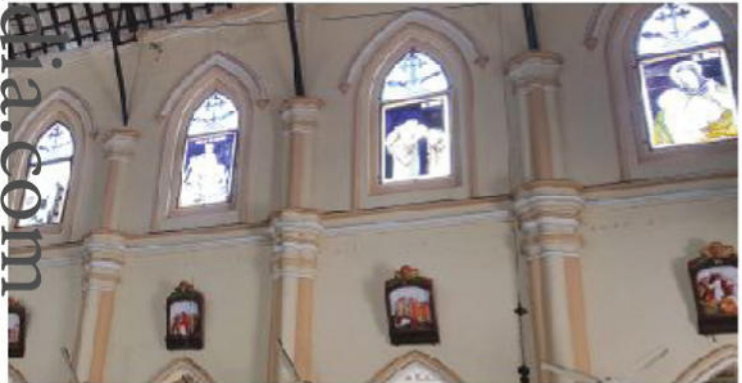
നെഗബോയിലെ സെന്റ് മേരീസ് പള്ളി

പിന്നീട് സെന്റ് സ്റ്റീഫൻസ് ചർച്ച് എന്ന ആരാധനാലയം സഭയുടെ പഴയൊരു ഡച്ച് പള്ളികൂടി നശിപ്പിച്ചു. അവിടെയും അൽത്താരയിലും ചുറ്റും മാർത്തോമ്മാ നസ്രാണികളുടെ സ്റ്റീവാ കണ്ടു. അനുരാധപുര സ്റ്റീവാ കണ്ടെടുത്തപ്പോൾ മുതൽ കത്തോലിക്കരും ആംഗ്ലിക്കരും മാർ സ്റ്റീവാ ശ്രദ്ധിക്കാൻ തുടങ്ങി. മൽസരിക്കുകയാണ്. കാരണം തങ്ങൾക്കാണ് പൗരാണിക സഭയുമായി അടുത്ത ബന്ധം എന്ന് കാണിക്കാനാണ്. അവരുടെ വേരുകൾ സംരക്ഷിക്കാനുള്ള ആവേശം കണ്ടപ്പോൾ എന്റെ സഭയെക്കുറിച്ച് ഒരു വട്ടം ആലോചിച്ചു.